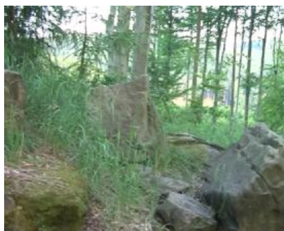
2. kameny sedadla vlevo, vztyčená stéla je uprostřed v pozadí, napravo skalka s otvory šterbinového tvaru pro nosníky přístřešku.