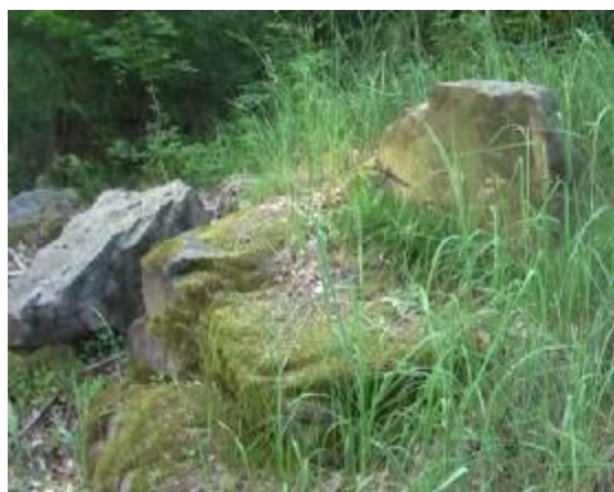
3. Pohled na kamenné sedadlo.