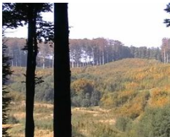
1. Pohled na sídelní vrcholek od jihu. Vlevo dole je mokřina, zbytek po rozsáhlém jezeře, největším v Chříbech, vzniklém přehrazením.

V Chříbských lesích se nachází velké množství dosud neprozkoumaných vrcholových sídel, jejichž skalní zbytky mají řadu společných znaků. Často na ústředním místě najdeme zachované kamenné sedadlo, je někdy obklopeno řadou menších kamených sedátek. Dalším pravidelným objektem bývá kamenný stůl, opracovaný kámen, který někdy vystupuje ze skalního podloží. Na některých stolech se nalézají i rýhy tzv. krevních kanálků. V blízkém okolí sedadla jsou obvykle zbylé kameny obytných staveb. Ty byly někdy zahloubeny, častěji jen přistavěny ke svisle zarovnaným vrcholovým skalkám. V sousedství sedadla bývá někdy vztyčený kámen, v jehož čele jsou stopy vyrytých znaků nebo zbytky plastických vyobrazení. Zde popisujeme skalní sídelní zbytky, které se nalézají na východním okraji přírodního valu obklopujícího obec Košíky. Lokalita leží asi 2 km severně od opevnění, které jsme již popsali dříve (1) a jehož kamenné artefakty ukazují na pravděpodobné sídlo vládce a snad i centrum celé této chříbské soustavy pevností. Detaily kamenných objektů ukazují následující obrázky.