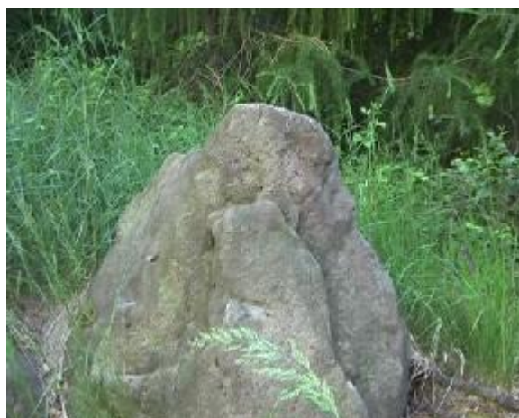
6. Vztyčená stéla s plastikou tváře, jejíž levé oko mělo tvar kosočtverce, symbol vládců.