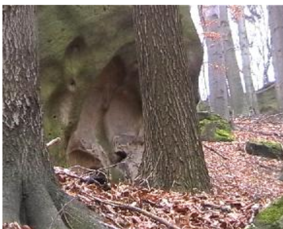
15. Plastika trojlístku na jiné skalce v sídle.