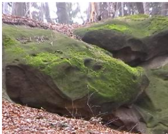
14. Jiné plastické zobrazení v sídle vládce.