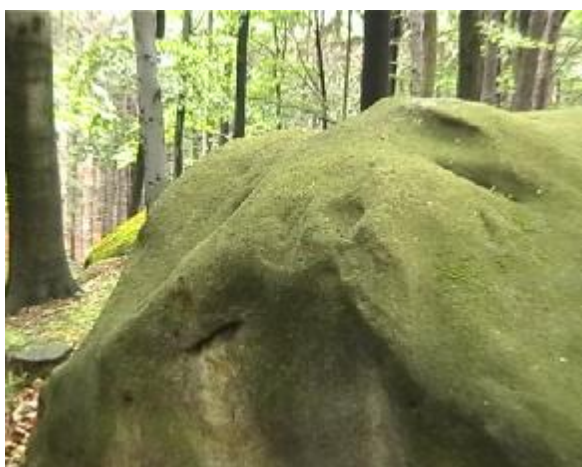
13. Ukázka plastiky v čele skalky sídla vládce