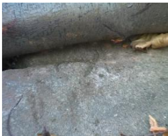
10. Detail krevní rýhy na povrchu stolu.