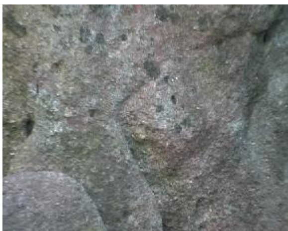
7. detail kosočtvečného oka postavy na stéle.