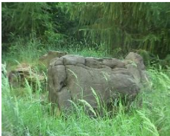
5. Opěrná skalka přístřešku, pohled zepředu.