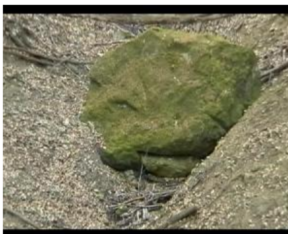
16. Balvan přehrazující strž, s plastikou hlavy ptáka a "vyspravením " chybějící části dole.