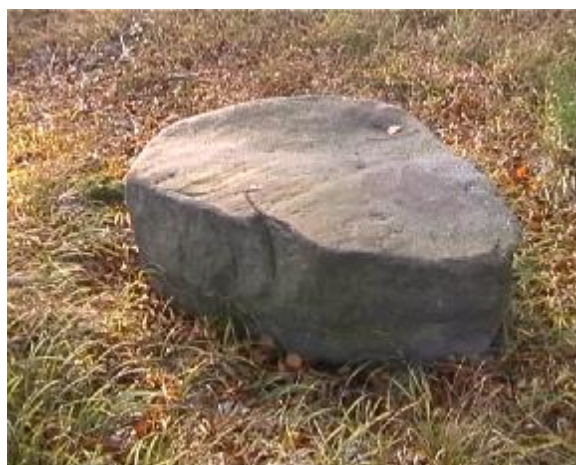
8. Celkový pohled na kamenný stůl v popředí.