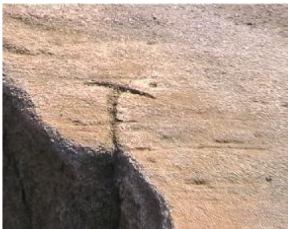
11. Detailní pohled na krevní rýhy.