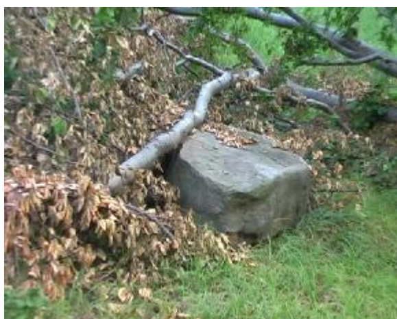
9. Pohled na stůl, který je nyní zavalen kmenem padlého stromu.