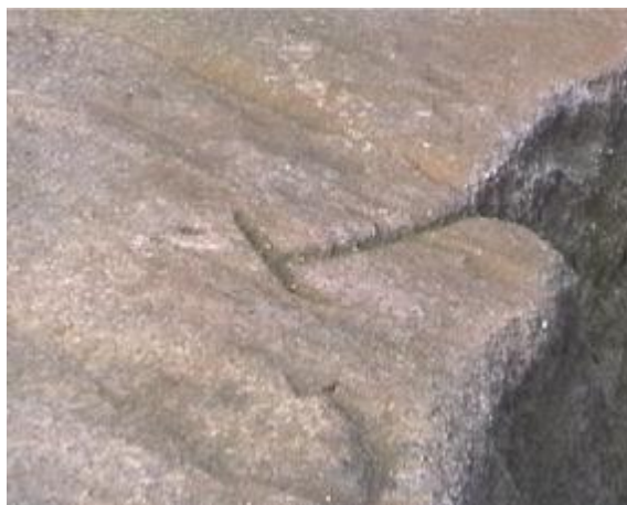
12. Krevní rýha z jiného úhlu pohledu.