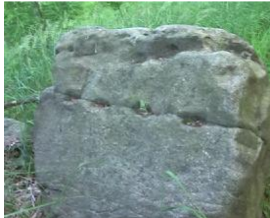
4. Detail skalky s patkami pro nosníky.