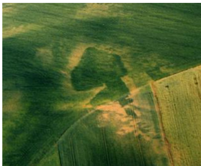
Silueta možné katedrály čeká na archeology.

K této stavbě se vážou celkem tři letopočty, jeden latinský „zkratkový nápis“ a několik kamenných artefaktů.