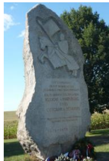
Památník bitvy v místě hromadného hrobu.