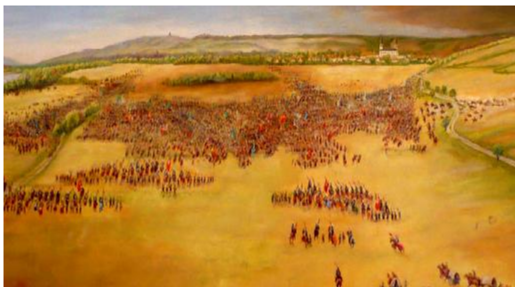
Obraz bitvy v okamžiku bočního výpadu Konráda ze Sommerau.